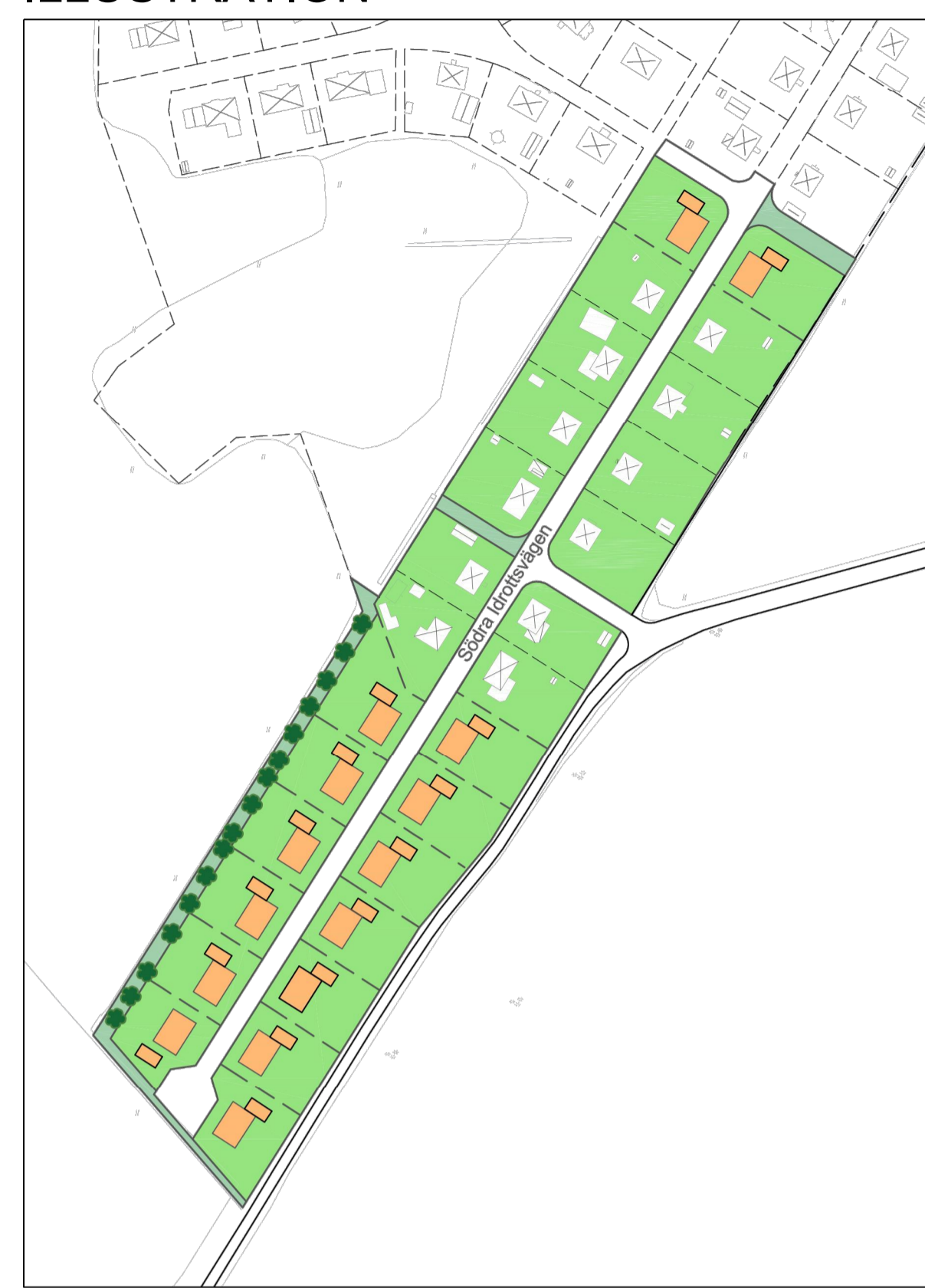
Illustrationen visar en möjlig utformning av planområdet under förutsättning att dispens från biotopskyddet ges.